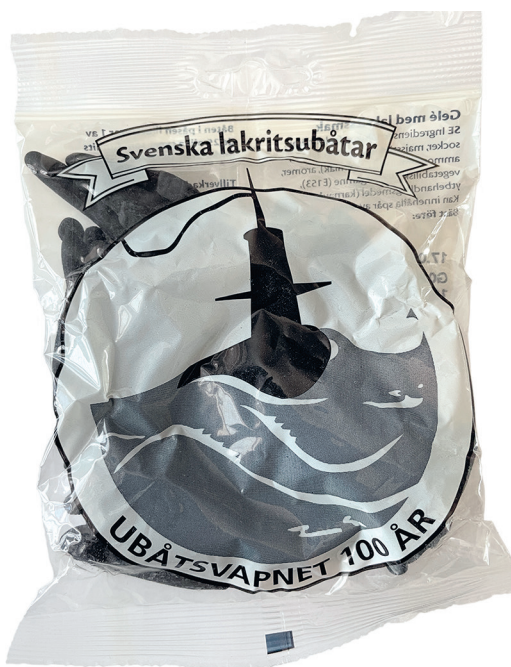
Ubåtsgodis från Ahlgrens.

Tack vare ett generöst bidrag till konferensen från en av Wallenbergstiftelserna blev det pengar över. Kontakt med Wallenberg om vad